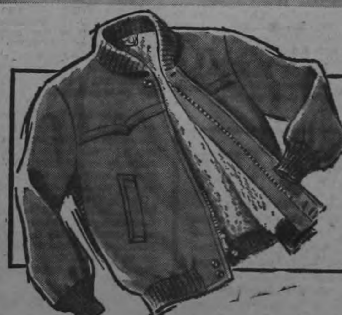
SENSACIONAL APERTURA DEL DEPARTAMENTO DE JACKETS PARA CABALLEROS Y MUCHACHOS

SEPRE SU MERCADERIA CON SOLO EL 10% DEL VALOR TOTAL DE SU COMPRA.