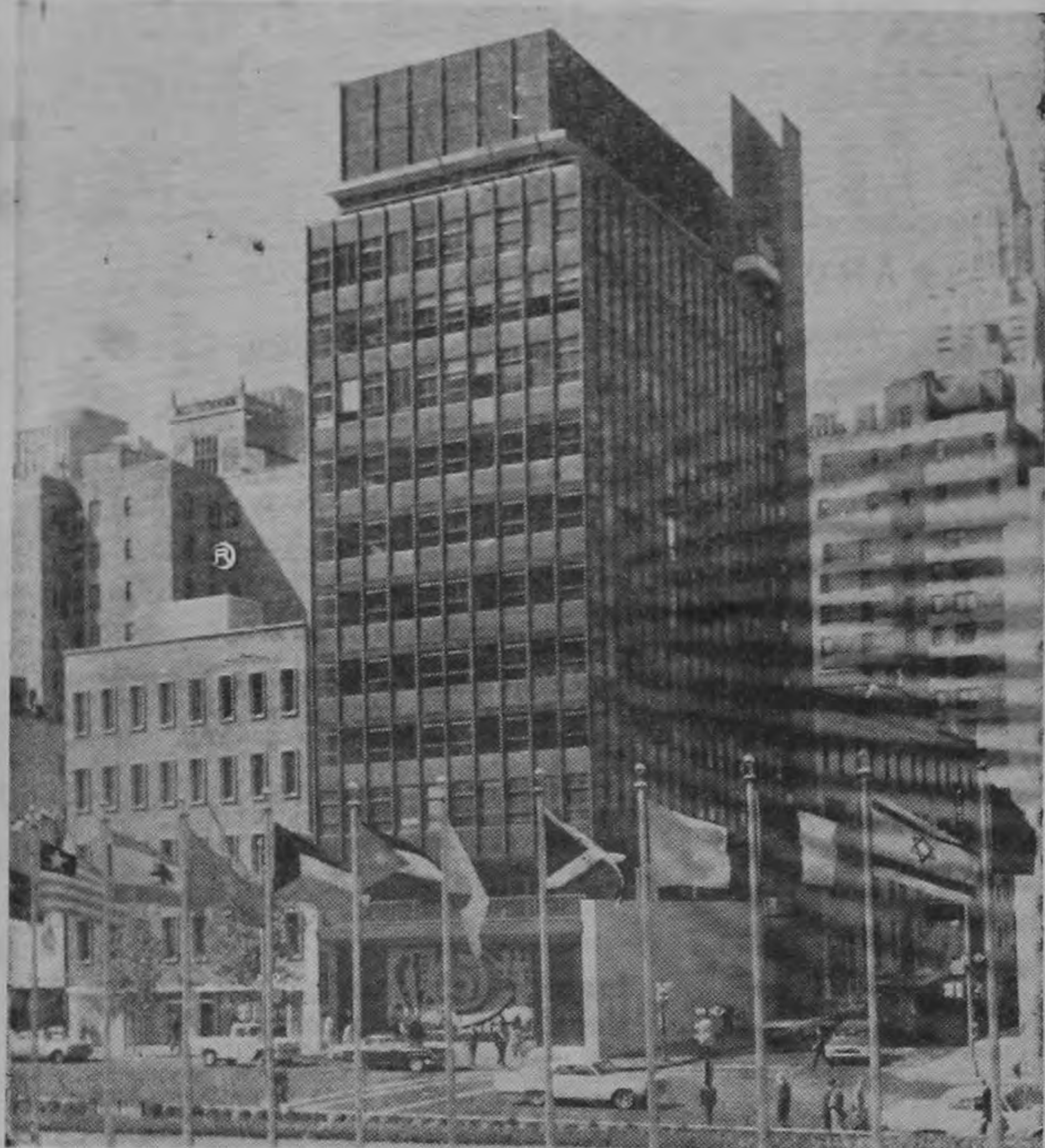
EN EL DIA DE LAS NACIONES UNIDAS.— Un nuevo Centro de Iglesias de las Naciones Unidas fue inaugurado recientemente en la ciudad de Nueva York, como "un sitio de paz, una ciudadela de concordia". El edificio, situado frente a la sede de las Naciones Unidas, fue construido por la Iglesia Metodista y será administrado por el