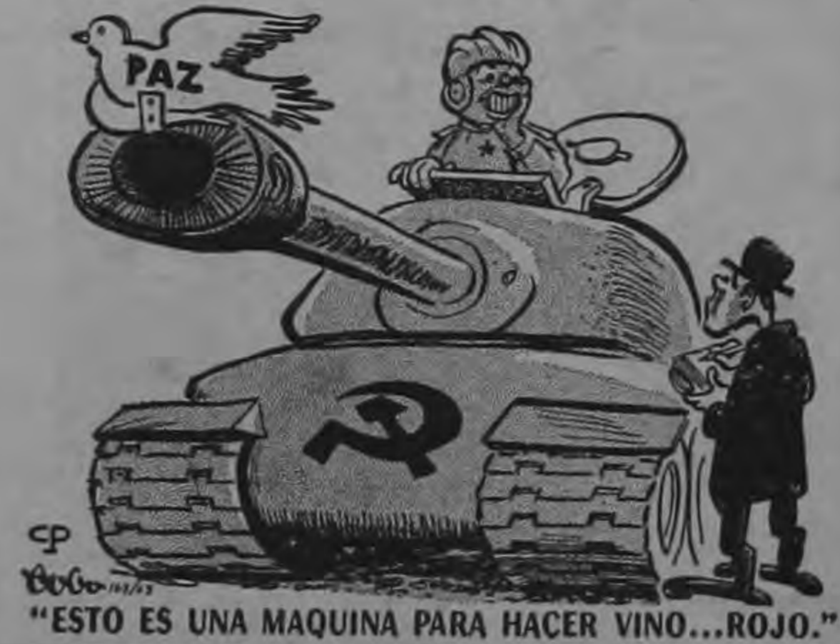
"ESTO ES UNA MAQUINA PARA HACER VINO...ROJO."

El joven ministro de Hacienda apuntó que el déficit no sólo se debe a la administración del expresidente Juan Bosch, sino a viejos males, pero señaló que la mala administración del régimen depuesto y sus medidas económicas incorrectas agravaron la situación.