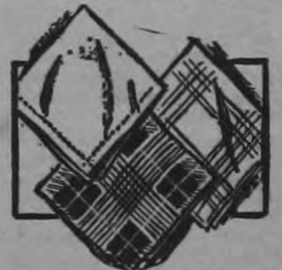
PANUELOS PARA CABALLEROS Precio Bajo de Sears ₡ 1.50

La prenda ideal por su extraordinaria confección en algodón selecto, estilo atlético con costuras principales reforzadas. Tallas desde el 34 hasta el 44.