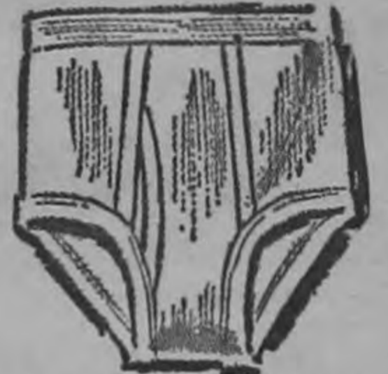
CALZONCILLOS PARA CABALLEROS Precio Bajo de Sears ₡ 4.50

En calidad especial de lana, estilo moderno de ala corta, atractivos colores a cuadros y lisos, una prenda de gran distinción por su magnífico acabado. Tamaños desde el 6 3/4 hasta el 7 1/2.