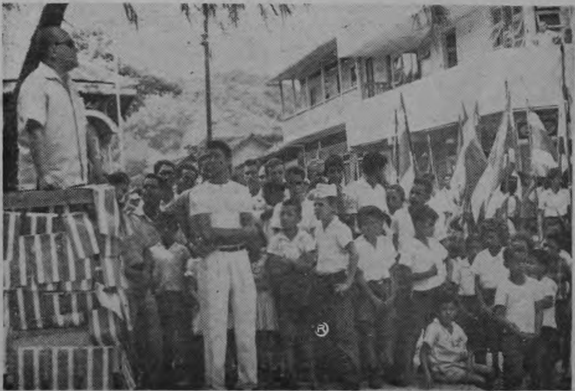
El señor Ministro de Salubridad Pública, doctor Terán Valls se dirige al pueblo de Nicoya, reunido en esta memorable oportunidad.

Cabe destacar la magnífica cooperación que le están prestando al programa los miembros de la comunidad organizados en Comités de Acción Comunal.