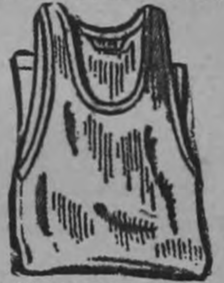
CAMISETAS PARA CABALLEROS Precio Bajo de Sears ₡ 4.50

La prenda ideal por su extraordinaria confección en algodón selecto, estilo atlético con costuras principales reforzadas. Tallas desde el 34 hasta el 44.