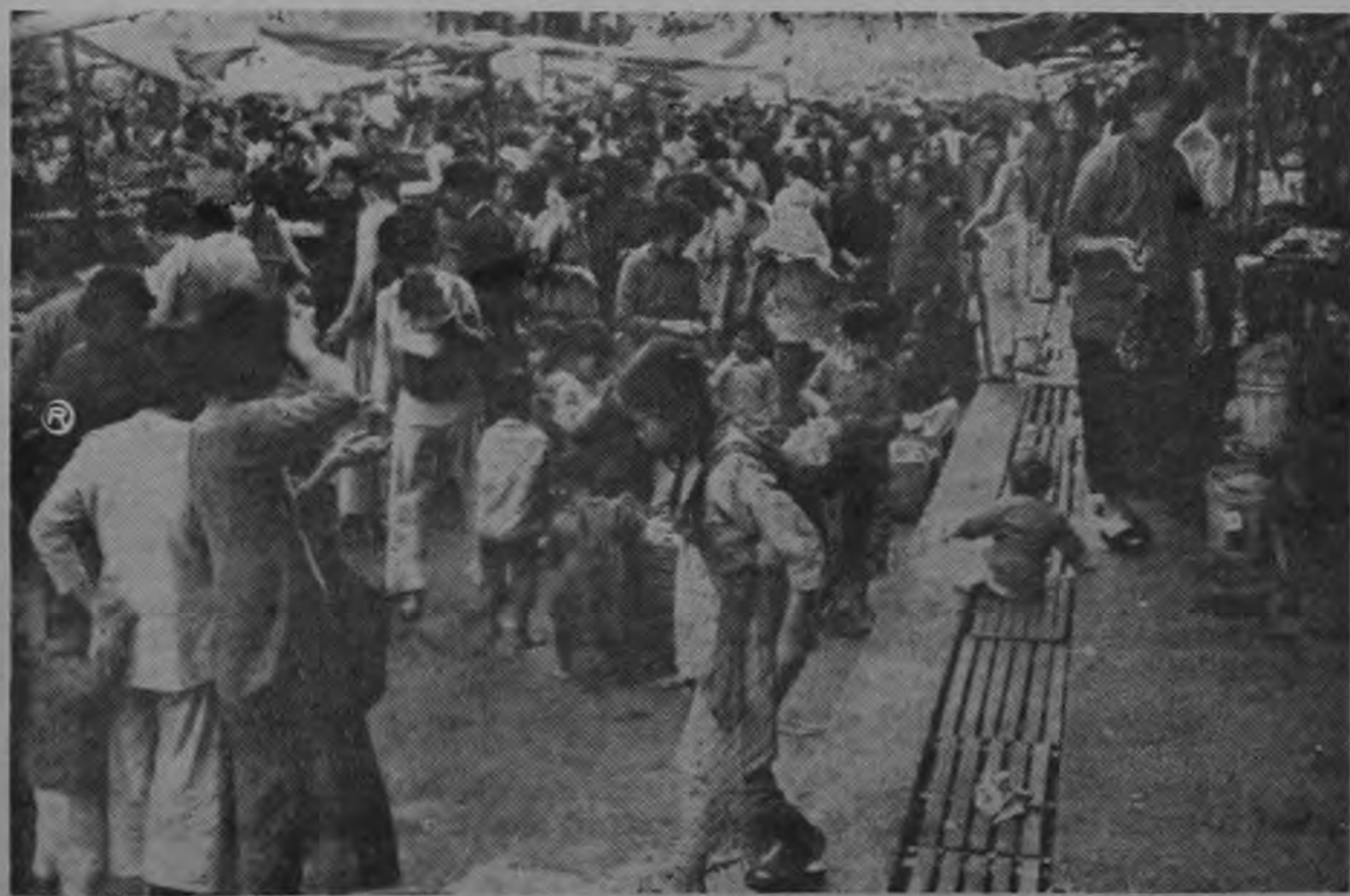
Los refugiados en Honk Kong. En los dos últimos decenios los organismos de las Naciones Unidas han ayudado a millares de refugiados a rehacer sus vidas. Pero en un mundo que se transforma rápidamente son todavía muchos los que