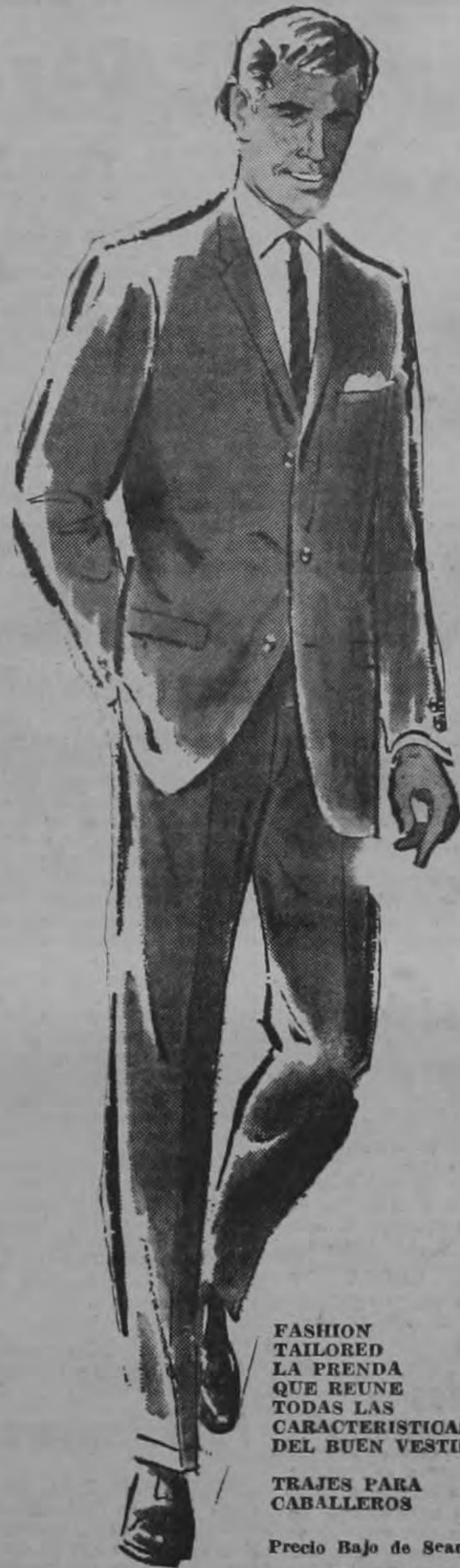
FASHION TAILORED LA PRENDA QUE REUNE TODAS LAS CARACTERISTICAS DEL BUEN VESTIR

De calidad especial en algodón peinado, atractivos diseños y colores firmes.